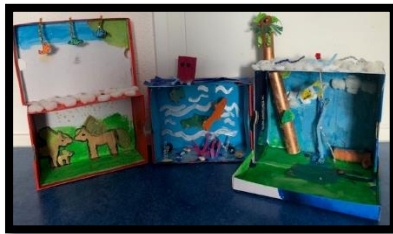
leefomgeving van een dier